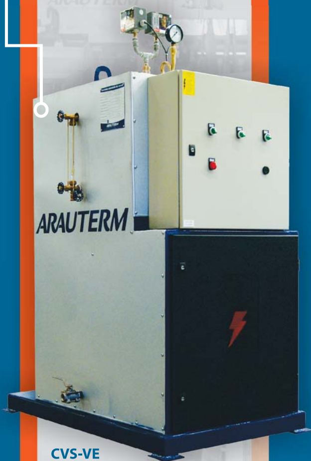
CVS-VE 380 volts